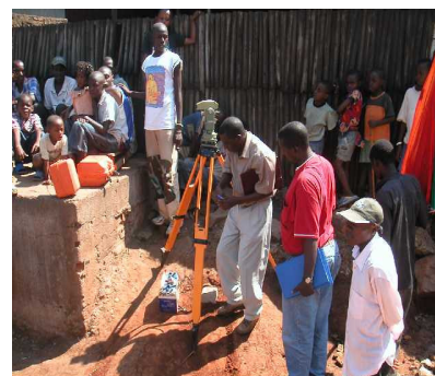
Lancement des études sur la 8ème avenue

Les études pour la maîtrise d'œuvre du pavage et l'assainissement de routes de Bwiza et de Nyakabiga seront menées par les bureaux d'études Geoprojet et Geosci sélectionnés suite à un deuxième appel d'offre. Leur lancement a été fait en présence de la presse le 21 août. Ces études porteront sur un linéaire de 10 km en commune de Bwiza et de 8 km en commune de Nyakabiga. L'exécution des travaux dépendra du budget disponible. Or, d'après l'avant-projet sommaire (APS), on constate déjà qu'il y a une inadéquation entre le budget et le nombre de routes à paver. Au pavage s'ajoute un volet de raccordement aux égouts et un programme de sensibilisation à l'hygiène afin d'améliorer les conditions sanitaires et environnementales dans les deux communes. A souligner également, l'importance d'une campagne cruciale de sensibilisa-