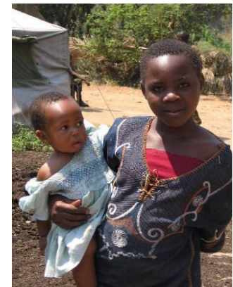
Les bonnes avec les nourrissons des stagiaires allaitant.

Avec les importants reliquats de cette ligne budgétaire, sont à l'étude, d'une