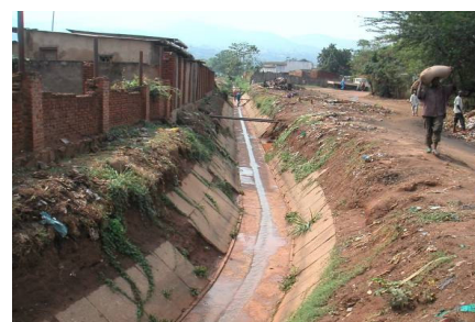
Après le curage