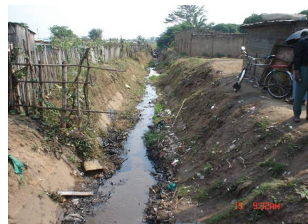
Avant le curage

tion à l'entretien des infrastructures mises à la disposition de la population bénéficiaire. Celle-ci sera mise en place au travers des Comités Locaux d'Entretien (CLE) avec l'appui de l'administration locale. A cette fin, le Programme d'Urgence collabore avec le PTPCE qui a mis en place et assure le suivi de ces CLE.