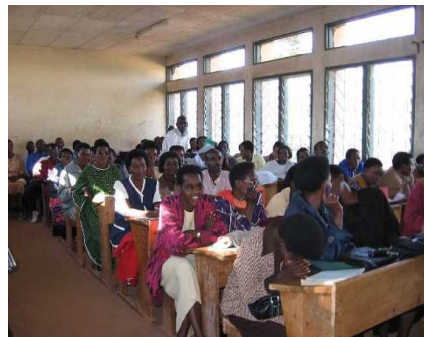
Formation des enseignants du 2ème primaire à Bururi

D'après une enquête d'évaluation auprès des enseignants, il ressort que 95% des enseignants estiment que le stage leur a permis de s'améliorer dans leurs cours : les bénéficiaires sont satisfaits, du contenu de la formation, de la qualité des formateurs et du contact avec les collègues. Néanmoins, selon cette enquête et les propres constats de l'équipe de moni-